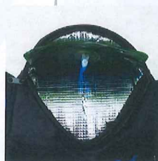
バックの内側はアルミ張り 保冷バック仕様