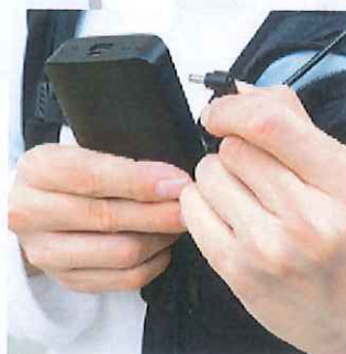
バッテリーは前面収納で 操作もしやすい